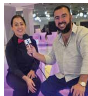
Sahara Müller Essência Drinks