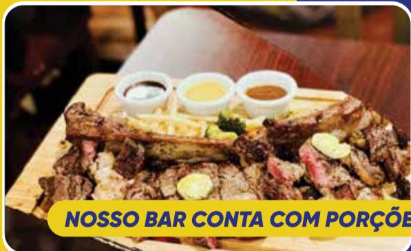
NOSSO BAR CONTA COM PORÇÕES