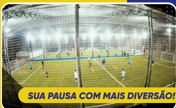
SUA PAUSA COM MAIS DIVERSÃO!