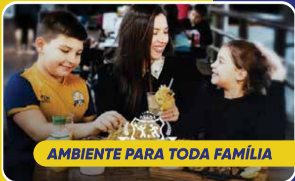
AMBIENTE PARA TODA FAMÍLIA

O Movimento Tarifa Zero São José também segue mobilizado na construção de um Projeto de Iniciativa Popular que pretende reunir pelo menos 10 mil assinaturas para protocolar oficialmente a proposta no Legislativo municipal.