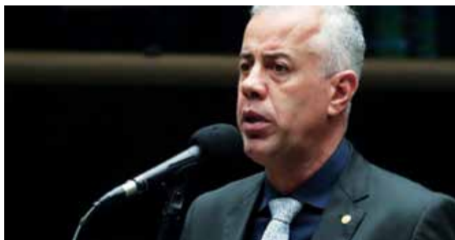
Novo projeto prevê uso obrigatório de salário de presos para reparação de vítimas