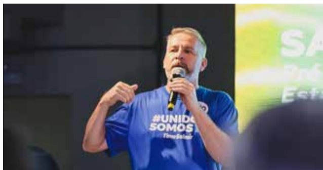
Salmir reúne lideranças amplia base política rumo a ALESC.